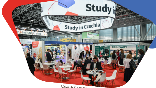
Veletrh EAIE 2024

» Jeden z největších přínosů vidím v tom, že jste nám otevřeli dveře tam, kam bychom se jako regionální univerzita těžko dostávali sami. Už to není jedna univerzita, ale stát, reprezentace vysokých škol a zástupci instituce mezinárodního vzdělávání. «